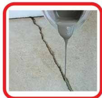
SIGILLATURA DI FESSURE SU PAVIMENTI IN CEMENTO