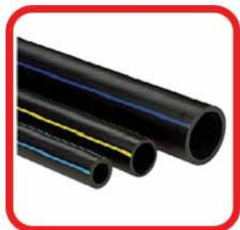
RIPARA TUBI IN POLIETILENE

INDICATO PER FISSARE STOP, BARRE FILETTATE RIEMPIRE FORI ED ALTRI SOSTEGNI SU CEMENTO.