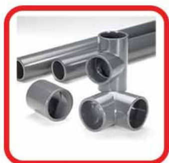
RIPARA TUBI IN PVC

IDEALE PER RIPARARE E INCOLLARE METALLI, ACCIAIO INOX, MATTONI, PIETRE, PIASTRELLE, MATTONCINI ORNAMENTALI DA ESTERNO.