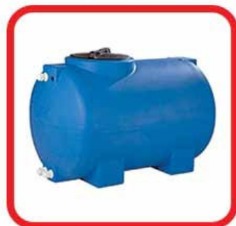
RIPARA SERBATOI IN POLIETILENE

INDICATO PER FISSARE STOP, BARRE FILETTATE RIEMPIRE FORI ED ALTRI SOSTEGNI SU CEMENTO.