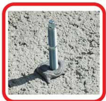
ANCORAGGIO DI UNA BARRA FILETTATA SU CEMENTO