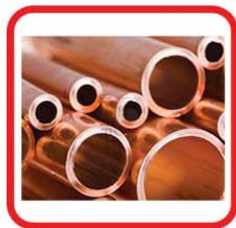
RIPARA TUBI IN RAME

IDEALE PER RIPARARE E INCOLLARE METALLI, ACCIAIO INOX, MATTONI, PIETRE, PIASTRELLE, MATTONCINI ORNAMENTALI DA ESTERNO.