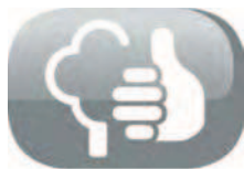
Respectueux de l'environnement (CO2 neutre)