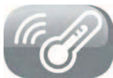
Programmation de la température