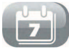
Programmation sur 7 jours